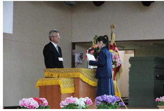
新入生代表の言葉