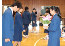
新入生へお花贈呈