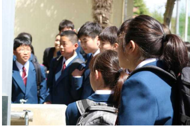
クラス発表の様子